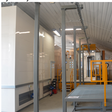
Transportadores de corrente contínua